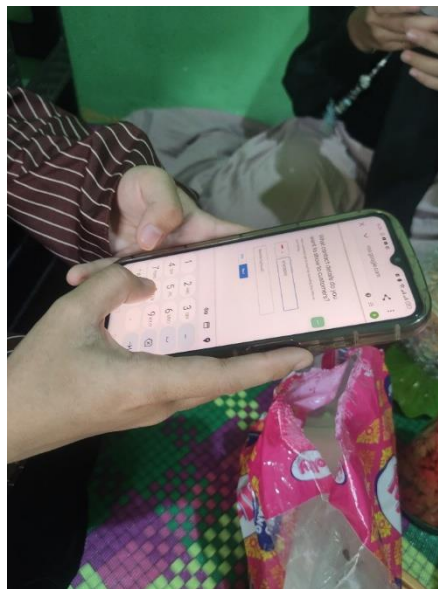
Gambar 1. Proses Menambahkan Lokasi Usaha Ke Google Maps

Proses ini dimulai dengan membuat atau masuk ke akun Google My Business. Setelah masuk, pemilik toko dapat mencari opsi untuk menambahkan lokasi bisnis baru. Pada tahap ini, informasi lengkap tentang toko kelontong harus diisi, termasuk nama toko, alamat lengkap, nomor telepon, jam operasional, dan kategori bisnis. Selanjutnya, pin lokasi toko kelontong ditempatkan pada peta Google Maps. Pemilik toko dapat memastikan lokasi yang tepat dengan menyesuaikan pin pada peta interaktif. Selain itu, menambahkan foto toko dan produk yang dijual akan membuat listingan lebih menarik dan informatif bagi pelanggan potensial. Setelah semua informasi diisi dan pin lokasi ditempatkan dengan benar, pengajuan lokasi baru harus diverifikasi oleh Google. Setelah verifikasi selesai, lokasi usaha Laksa Mamak Kembar akan muncul di Google Maps, memudahkan pelanggan untuk menemukan lokasi, mendapatkan petunjuk arah, dan melihat informasi penting tentang toko. Hal ini tidak hanya meningkatkan visibilitas online toko tetapi juga membantu dalam menarik lebih banyak pelanggan, meningkatkan omset penjualan, dan memperkuat kehadiran digital UMKM Laksa Si Kembar. 23