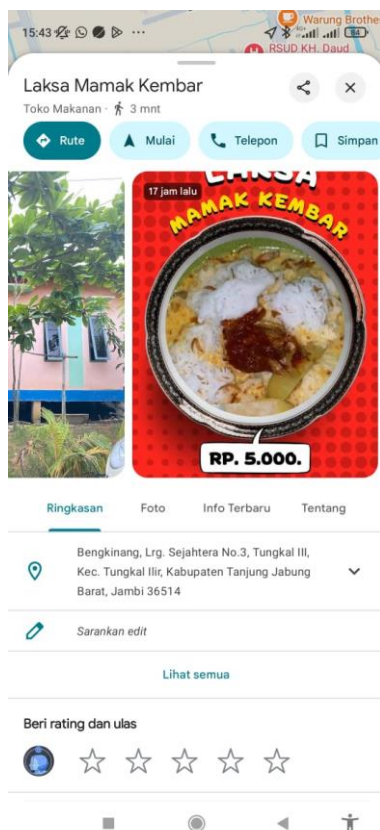
Gambar 3. Dokumentasi Publish Lokasi Usaha Laksa Mamak Kembar Di Google Maps