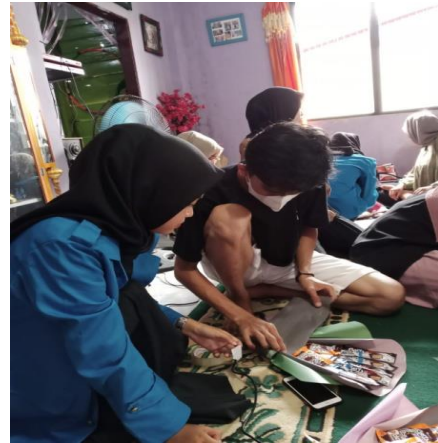
Peserta sedang mempraktikkan dan Pendampingan