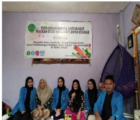
Sambutan dan penyampaian materi 1