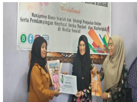
Penilaian dan penyerahan perhargaan kepada satu peserta terbaik