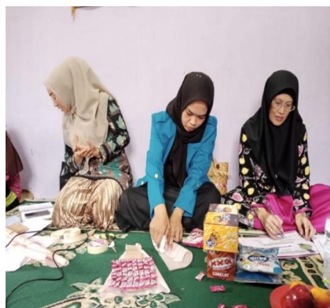
Praktik pembuatan snack bucket dan market place