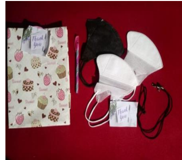
Sertifikat dan doorprize untuk semua peserta

Dari kegiatan ini peserta merasakan bahwa kegiatan ini sangat bermanfaat. Adapun manfaatnya sebagai berikut: