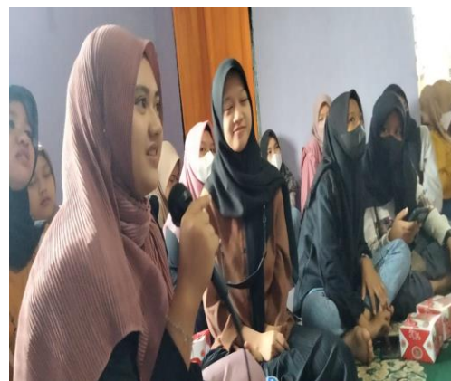
Peserta sedang bertanya