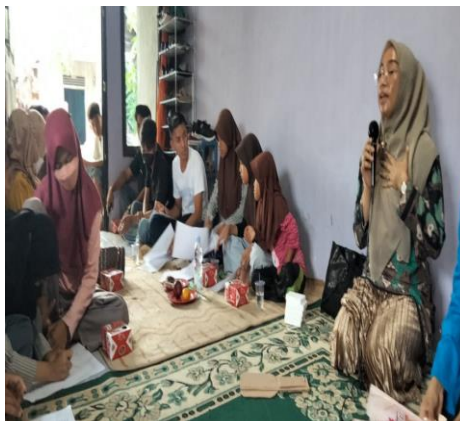
Penyampaian materi 2