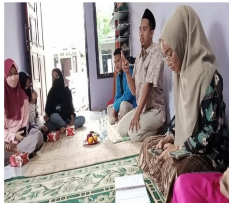
Penyampaian materi 1